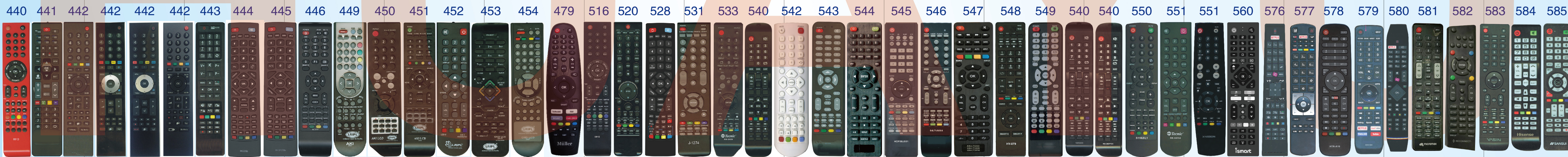
440 441 442 442 442 442 443 444 445 446 449 450 451 452 453 454 479 516 520 528 531 533 540 542 543 544 545 546 547 548 549 540 550 551 551 560 576 577 578 579 580 581 582 583 584 585 051D RED 33585 RC33729 HOB842 34090 34091 RC31277 Fusion RC25b RCF23b RC-E23 AKI AK61 AKI LCD AK66 AKI LCD AK68 AKI-OND IGO LCD ONIDA LCD ONIDA LCD ON87 RC1818 IR-V1 051D BLACK SNOWA 51163 BLAUPUNKT J-1274 RM-SK09 MERTER 33186 BRAVIS LED-1615 Marshal ME-2409 ONIDA LCD1 Akai HOF08J001 Polar 94 LTV6004 AN-LT3222 AN-LT3225 AN-LT2416 FUSION HY-079 SATURN LED40FHD500U DEXP 16A3000 RUBIN RB -28D7T2C DNS S19ASL1 RM-NS760 X.VISION 06 539W39-XV02X iSmart ATV VESTEL LCD T1396 VESTEL LCD HTR-A10 EN3V39H VESTEL LCD T1560 MICROMAX RECONNECT YASIN HISENSE SANSUI 80065455