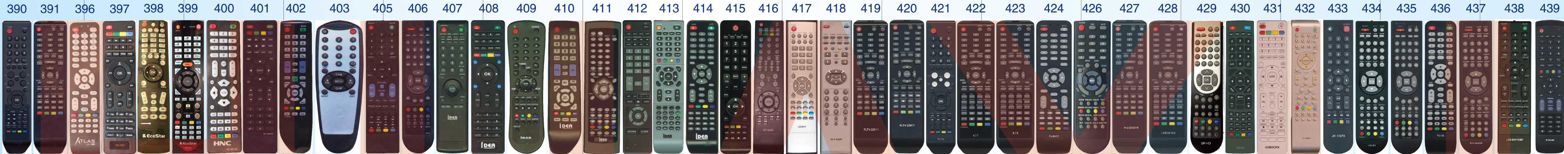
390 391 396 397 398 399 400 401 402 403 405 406 407 408 409 410 411 412 413 414 415 416 417 418 419 420 421 422 423 424 426 427 428 429 430 431 432 433 434 435 436 437 438 439 TRUMAN union tech ATLAS HD100 HOB688 ATLSS HD-200S KK-Y331J KK-Y331J HD LED100 GBTY ONGOV59 XY-B02E LCD TV PHONAR PHONAR LED TV DAWA MV iDEA iDEA iDEA iDEA iDEA iDEA iDEA iDEA AOC-02 DEX LT-2220 ORION LED2643 Akai SLP-006P Fusion FLT V 22H11 Fusion FLT V 32H17 FUSION RC15b Shivaki K77 Shivaki K78 Supra TV-DVD RC-GK22G1 H-LCD3210 LED321LC SKYPRIME HD SUPRA RC21b-1219 ORION LCD TC1860F1-RS JH-11370 LED-851 RC-D3 YC-53 STV-22LED5 LED-EH4720BF DNS M28AM8