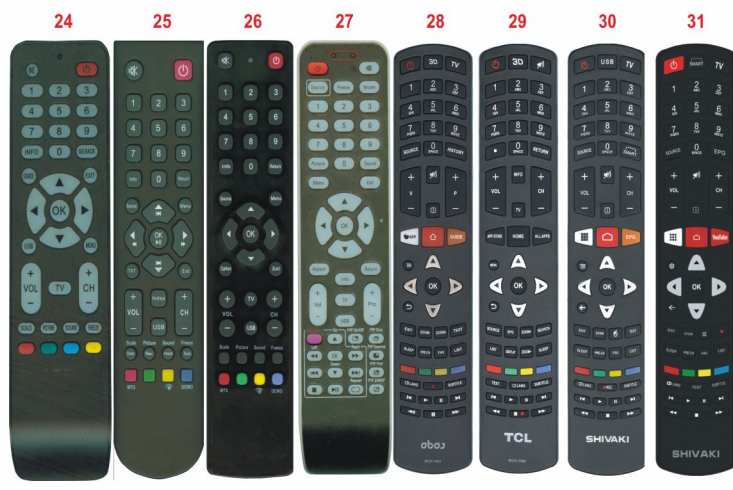
Rc311 FA1 RC311 FM2 Shivaki Shivaki