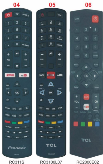
RC311S RC3100L07 RC2000E02

1, Turn on your TV set, let your TV set be in the normal state play, and aim the remote controller in the front of the TV. 2, Press and hold the "MUTE" button for about 6 seconds, the remote controller will enter automatic search state, please pay attention to your TV, see the volume symbol appears on your TV or not, if yes, please release "MUTE" button at once, set finished. 3, Test other function buttons can work well or not, If not, repeat steps 2 to 3, until you find the suitable code.