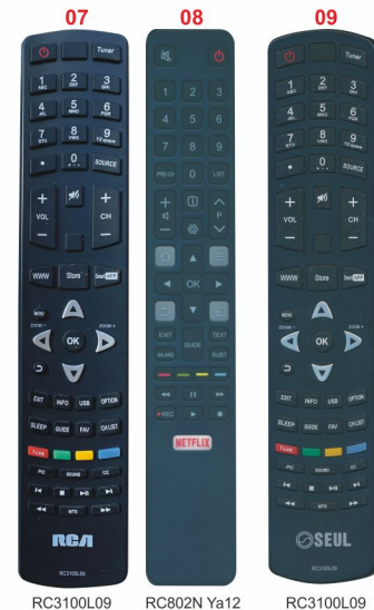
RC3100L09 RC802N Ya12 RC3100L09

List some suitable types of remote control according to relevant materials, for your guidance.