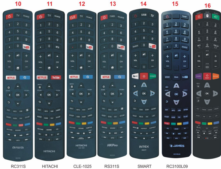
RC311S HITACHI CLE-1025 RRS311S SMART RC3100L09