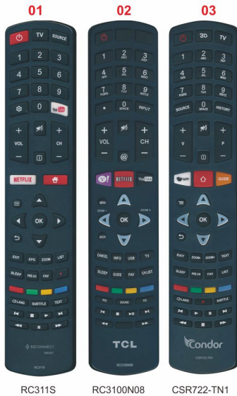
RC311S RC3100N08 CSR722-TN1

Thank you for using our company remote control product. RM-L1330+2 is a newly developed universal remote control product for TCL brand LCD/LED TV. Please try it after installing batteries at first time, if all functions are normal, you can use directly without setting. If it can't work normal, you need to make the following setting, then you can use for your TV. This remote control has a permanent memory function, no need to be reset when you change batteries.