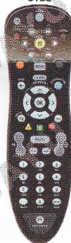
MOTOROLA MXv3 VIP2262E