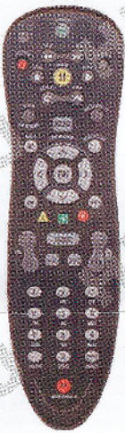
MOTOROLA MXv3 Rc1534849