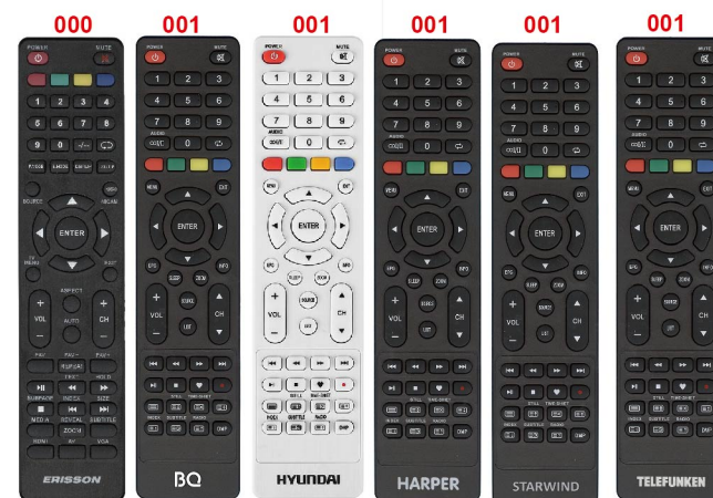
ERISON_28_32_39_42LEN52(1338) JKT-107 13715 JKT-107 7766 001-JKT-107 18231 JKT-107 18814 JKT-107 19646

Дальность действия пульта: до 10 метров, в зависимости от модели пульта. Тип батареек: 2 батарейки AAA.