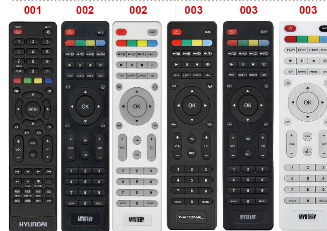
JKT-107 HOB1945 KT1045 MTV-2622LW black KT1045 MTV-2622LW white MTV-3224 LT2 11121 MTV-3224LT2 11189 MTV-3224LT2 13404