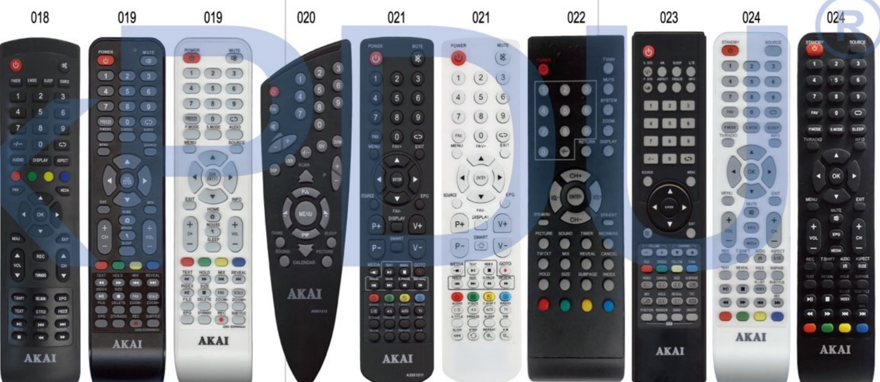
Akai Y-72C2 MEDIA