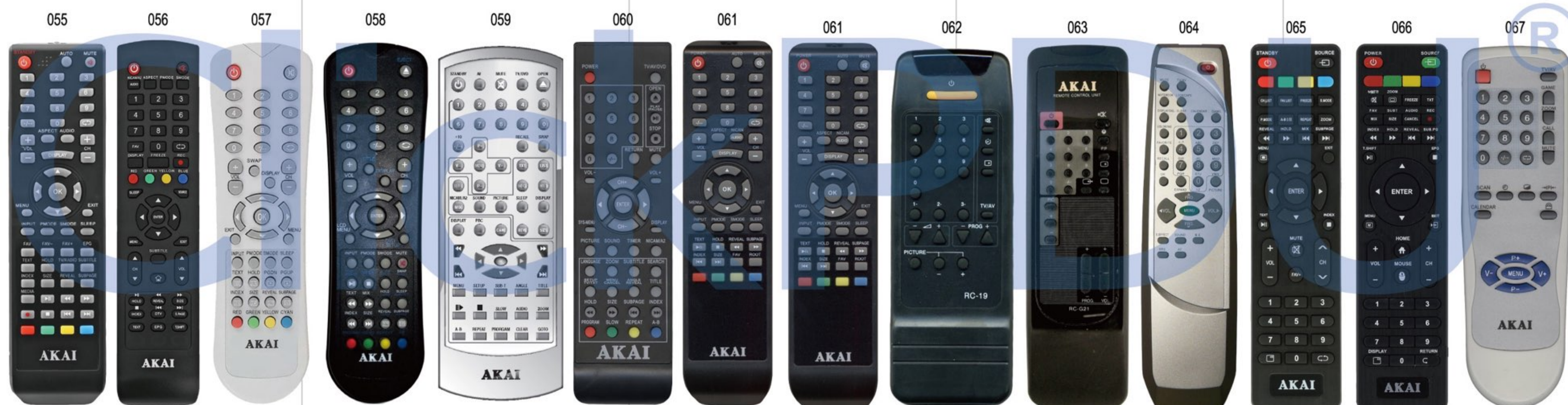
055 LEA-39K48P 056 LES-32X82WF 057 LTA-15E307 058 LTA-15E307D 059 LTA-20E305DMT 060 LTA-2695D 061 LTA-15022M 061 LTA-15022M 062 RC-19 063 RC-G21 064 RM-40 065 RS41C0 TEXT 32LED38P 066 RS41-MOUSE 067 WH-55A