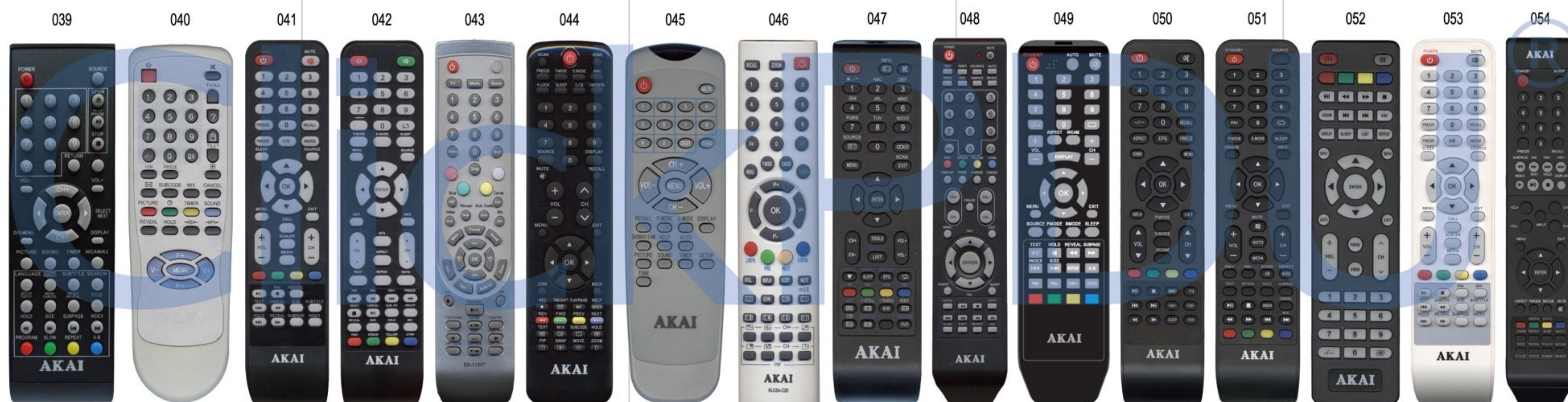
039 ALED2402 040 BT-0384A 041 BT0534 042 CX-507 043 EN-31911 044 HTR-D18A 045 KEX2C-C4 046 KLC5A-C20 047 LEA-19C11P 048 LEA-19V07P 049 LEA-24N20P 050 LEA-32B27M 051 LEA-32B49P (BAP2) 052 LEA-32B49P 053 LEA-32M19P 054 LEA-32S02P